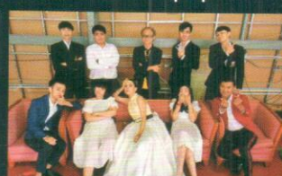
SOM POR DEE