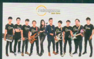
พลังหนุ่มแบนด์