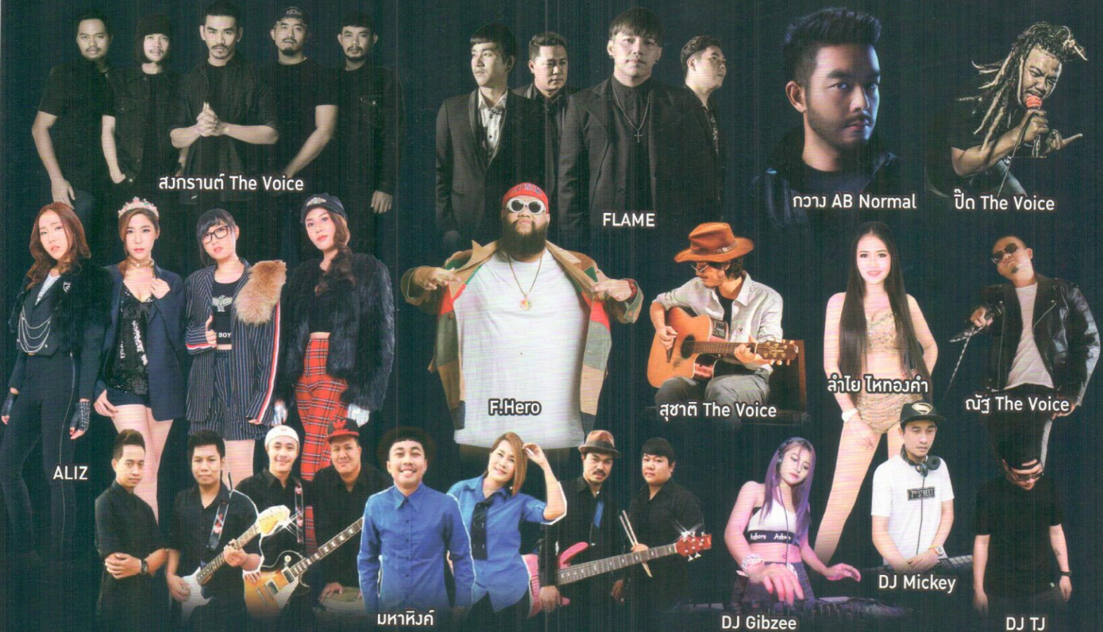
สงกรานต์ The Voice

เพื่อเป็นการโปรโมทการท่องเที่ยวในโคราชและประเทศไทย และดึงดูดนักท่องเที่ยวต่างชาติ จึงเป็นงานที่ทุกคนไม่ควรพลาด..!!