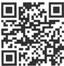
QR Code Website

สถาบันวิจัยและพัฒนา มหาวิทยาลัยราชภัฏนครปฐม 85 ถนนมาลัยแมน อ.เมือง จ.นครปฐม 73000 เบอร์โทรศัพท์ 0-3410-9300 ต่อ 3909 Email: conference12@webmail.npru.ac.th เว็บไซต์ http://dept.npru.ac.th/conference12